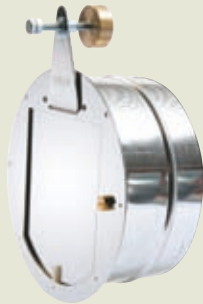
Modèle présenté : Z150