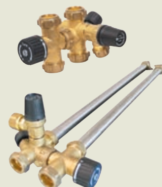
Modèle présenté : Kit sanitaire Série I